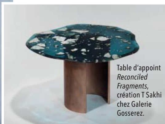
Table d'appoint Reconciled Fragments , création T Sakhi chez Galerie Gosserez.

La malléabilité et sa fragilité font d'elle un matériau unique qui interpelle les designers, séduits par la liberté qu'elle apporte et challengés par les difficultés qu'elle impose. Travaillée seule en moulage, la résine, pleine et massive, joue avec la lumière en fonction de l'éclairage environnant. À la façon d'un épiderme ou d'un voile givré, elle enveloppe les formes. Moulage ou bloc à déformer et à usiner, matière à gratter et polir, les créateurs exploitent les différentes techniques permettant une variation d'aspects et de propositions esthétiques.