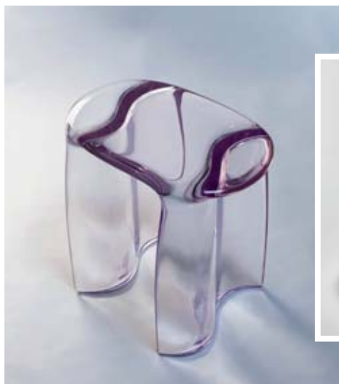
Tabouret Liquid , collection New Wave , création Lukas Cober chez Galerie Gosserez.